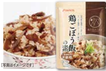
[写真はイメージです]