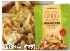
[写真はイメージです]