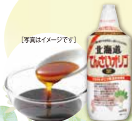
[写真はイメージです]

申込番号 内容量 1kg 01980 1本 1,500円 01984 4本 4,800円 (1本あたり1,200円) 01988 8本 8,400円 (1本あたり1,050円) 2027年12月24日(未開封)