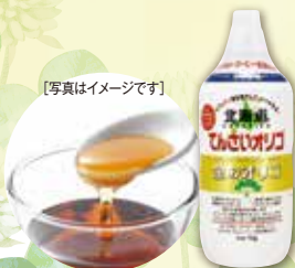
[写真はイメージです]