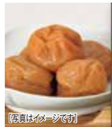
[写真はイメージです]