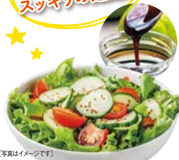
【写真はイメージです】

じゃばら果皮エキス + じゃばら6倍濃縮果汁 + はちみつ + ナリルチン約3200mg