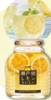
[写真はイメージです]

申込番号 内容量 220g 95221 1袋 923円 95225 5袋 4,285円 (1袋あたり857円) 賞味期限:2026年6月7日(未開封)