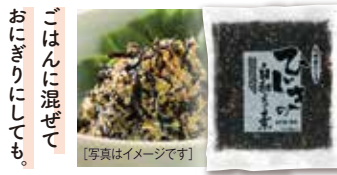
[写真はイメージです]