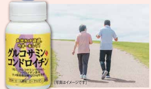
[写真はイメージです]

1粒中 グルコサミン150mg コンドロイチン含有 サメ軟骨抽出物120mg メチルスルフォニルメタン、 ビール酵母、ローヤルゼリー配合