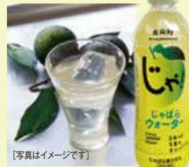
【写真はイメージです】

はちみつのやさしい甘みで飲みやすい、じゃばら果汁入りドリンク。花粉の季節のすっきり習慣に！