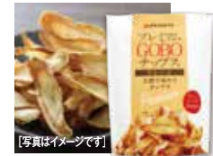
[写真はイメージです]